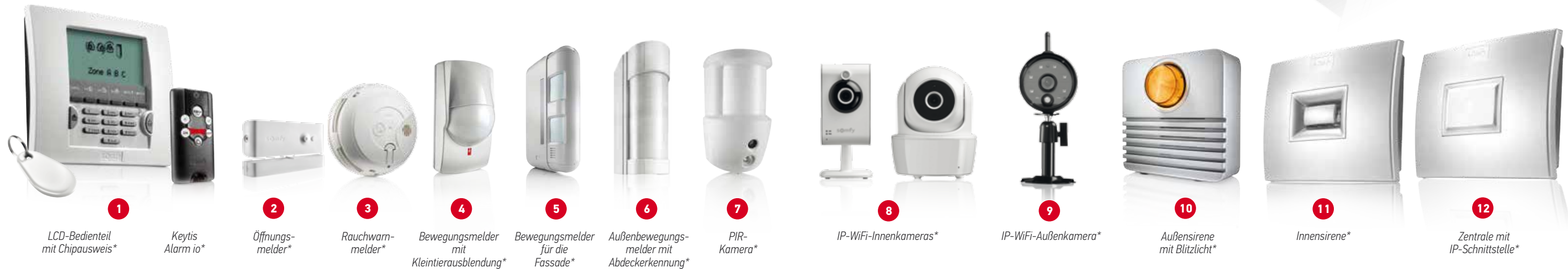
1 LCD-Bedienteil mit Chipausweis*